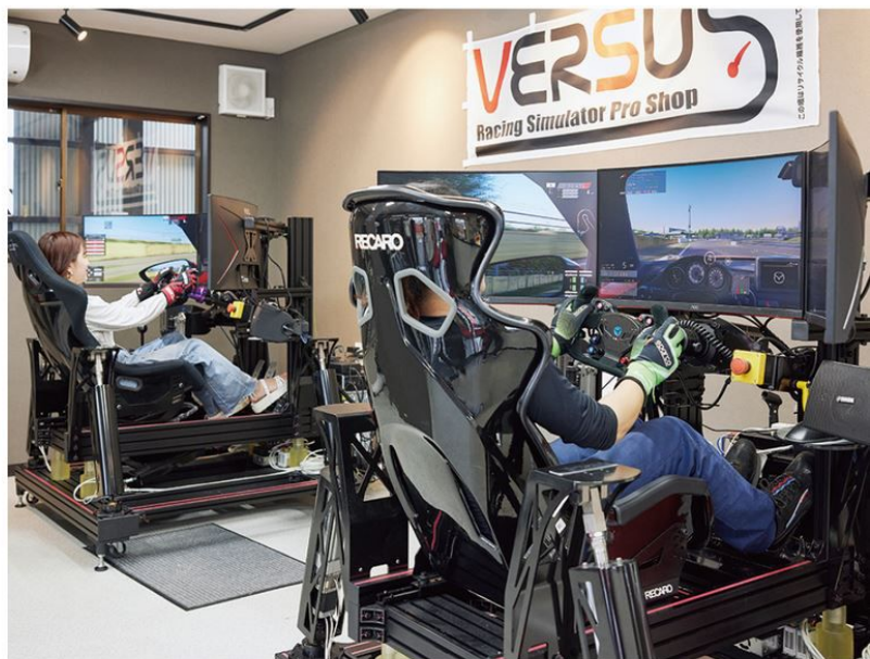
あふれ出す臨場感! 高速走行を味わえる超リアルシミュレーション体験を