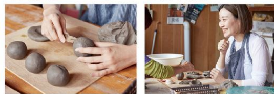
土に触れる気持ちよさに驚くはず 何が出来上がるかはあなた次第