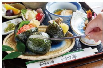
特製鬼切(おにぎり)御膳付き