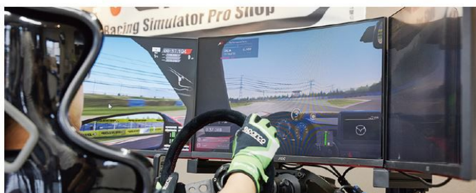
お好みのサーキットコースを選択。実在するコースを超高速で走行できる