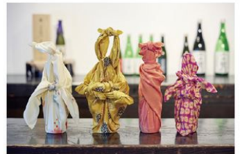
風呂敷を使った包み酒のレクチャーも