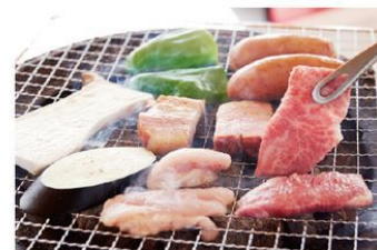
炭火でジューシーに炙り焼き