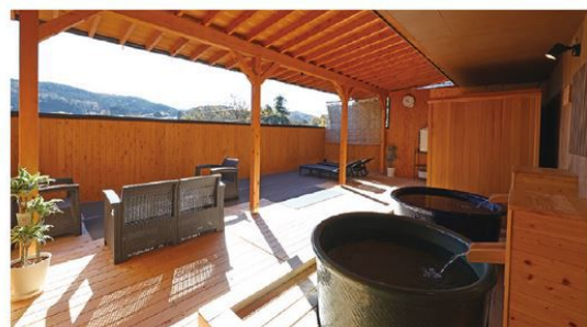
サウナのロウリュウは主人こだわりの香り付きも。ととのいスペースも充実!

約300年以上の歴史のある白狐温泉。その温泉を守り続ける今井屋で、大浴場・ヒノキ風呂・サウナ(ロウリュウ付き)&ととのいスペースが揃ったワンフロアを貸し切ることができる贅沢体験。お風呂上りは、のんびり湯上りタイムを。今井屋名物の五平餅と、季節のかき氷がお部屋に届きお腹も満たされる休日を楽しんで。