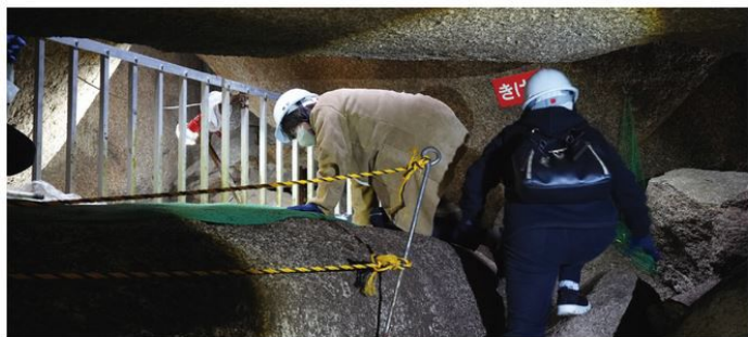
まるで探検隊気分!? 狭い岩穴を進むエリアや細く急な階段をよじ登るエリアも