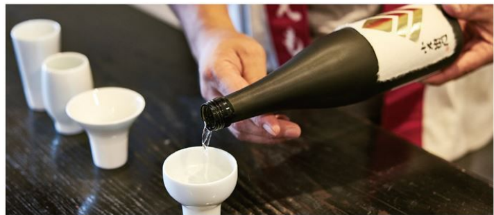
「純米大吟醸」をはじめ、3種のリキュールもテイスティングできる贅沢体験

創業300年以上の老舗酒蔵で大人の日本酒体験を楽しむことができる。形の異なる4つの美濃焼の酒盃によって変わる日本酒の味わいや香りをテイスティング。併せて、酒蔵オリジナルの6種のリキュールからお好みの3種を味わえる贅沢プラン。通常購入できない酒米2合と特別純米酒1本(180ml)のお土産付き。