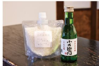
お土産に酒米2合と特別純米酒1本付き