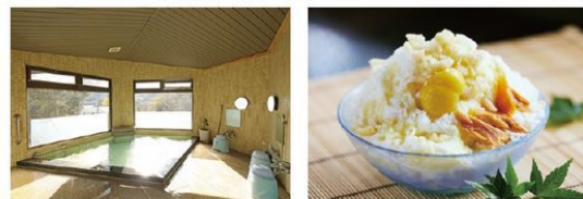
燦々と日が差し込む内湯大浴場「百庵」 湯上りのかき氷は至福の味わい♪