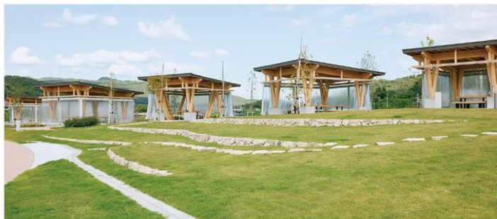
「きなあつ瑞浪」に隣接した場所で2023年6月に開園したBBQ広場

手ぶらで楽しむBBQは、瑞浪ボーンポークや飛騨牛のサイコロステーキ&カルビ、奥美濃古地鶏、ボーンポークのフランクフルトなども付いてボリューム満点。更に、選べる瑞浪市内の酒蔵の地酒(300ml)と瑞浪市のクラフトビールからお好みをそれぞれ1本チョイスでき、まさに瑞浪市の味わいを堪能できるプラン。