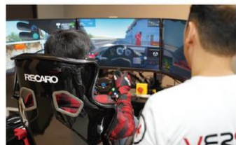
いつの間にか夢中になります