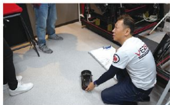
オーナーの的確なアドバイスも