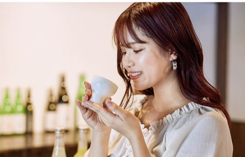
酒盃の形によって味わいが変わる!? 日本酒の味わいの変化を楽しんで