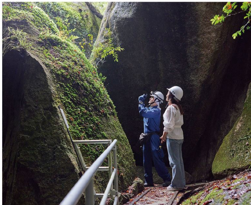
ガイドなしでは立ち入れない鬼岩公園の特別エリア。鬼岩にちなんだ昔話は必聴

●服装 / 汚れてもいい服装・動きやすい靴(トレッキングスタイル推奨) ※ヘルメット・軍手の貸し出しは体験料金に含む