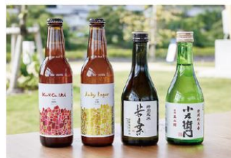
地酒・クラフトビールの飲み比べ