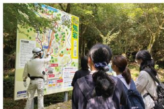
鬼岩公園のご案内からスタート